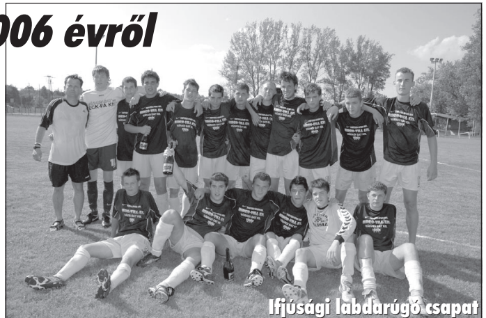
Ifjúsági labdarúgó csapat