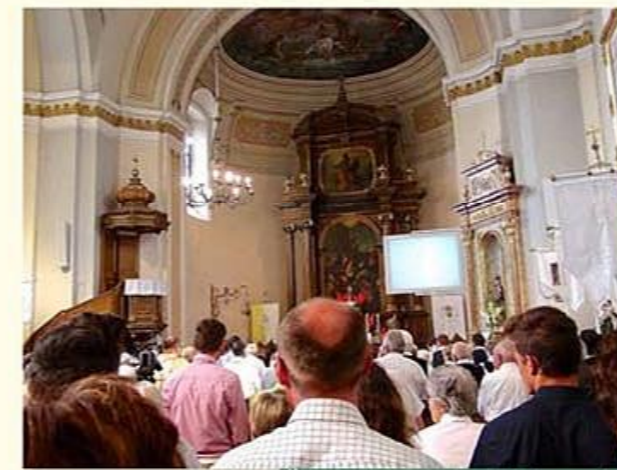
Ünnepi szentmise 2014 nyarán