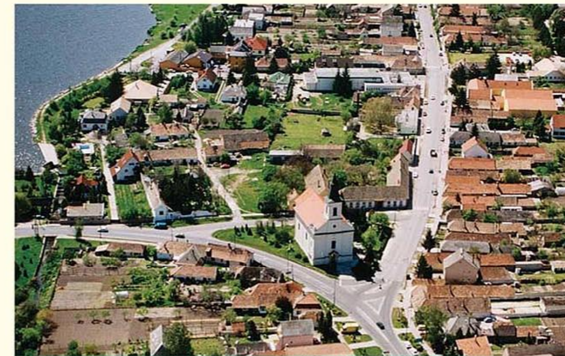
A környei templom és a faluközpont az ezredfordulón készült légi felvételen