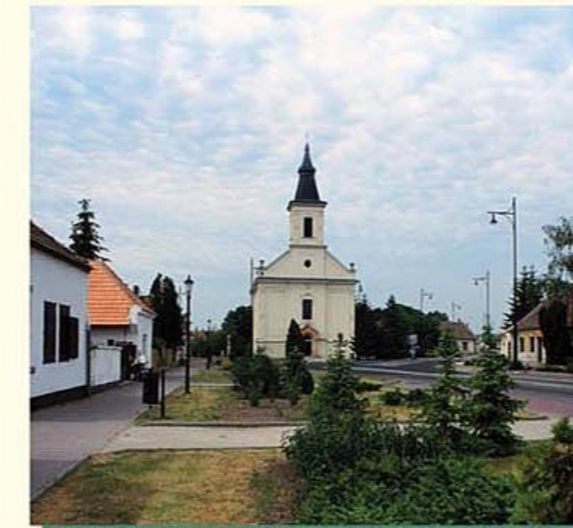
A felújított templom köszönti a községbe érkezőket