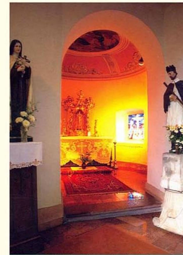
A keresztlő kápolna kincse a barokk tabernaculum