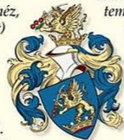
Az Esterházy család címere

Két nyomós érv sietette a templom építését. Az egyik ok az volt, hogy a falunak már kicsinek bizonyult a Fellner Jakab által épített második templom. Ezt – a falu újkori történetében – második katolikus templomot úgy kell elképzelnünk, hogy hasonló volt a kecskédi templomhoz, csak nagyobb, és a templombelső a barokk kornak megfelelő fali festményekkel díszítették a földtől a plafonig. A templom alatt kriptarendszer volt kialakítva. A másik ok a templomépítésre az 1841-es hatalmas tűzvész volt, mely nem kímélte a templomot sem. A kegyúr és hívek közös szándéka volt az új templom építése, amelyre azonban több mint húsz évet kellett várni. Az Esterházy család 1865–1866-ban segítette az új Isten háza építését Ybl Miklós 1860-as terve alapján. Az újraszentelésre 1867. augusztus 7-én került sor. A templom építéséhez az anyagot a