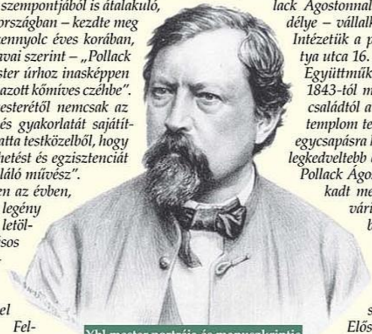
Ybl mester portréja és manuskriptje