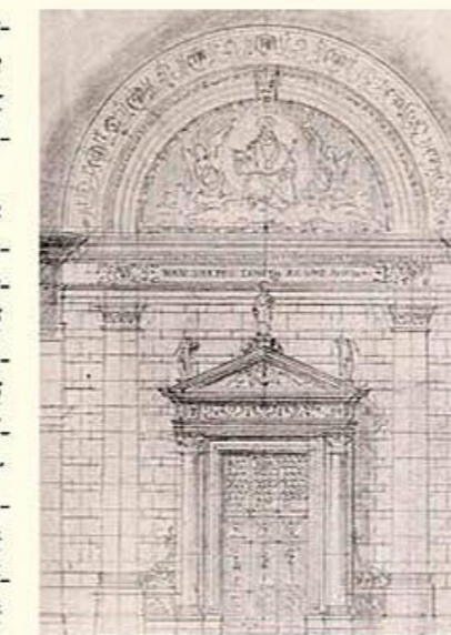
Utolsó rajza a Bazilikához

A nagyszabású építkezéssel Krúdy Gyula is meg-