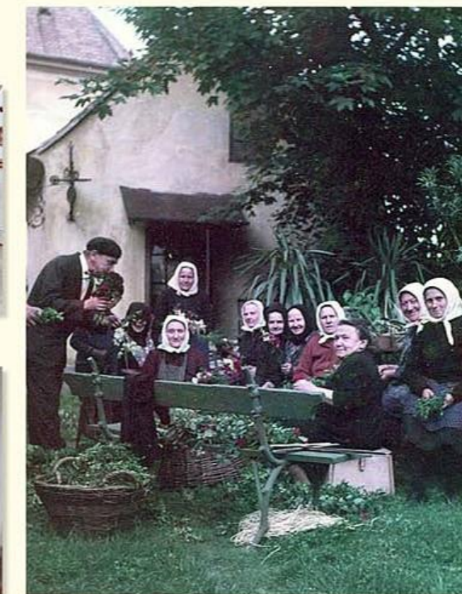
Úrnapi körmenetre készítik a sátrakhoz a virágokat Környe idősebb asszonyai