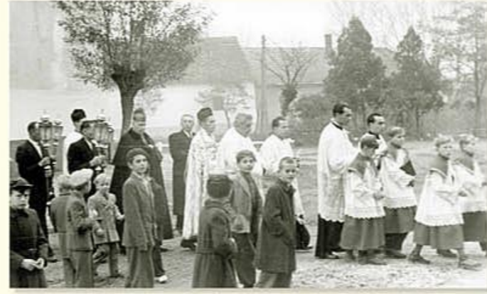
Papp Kálmán győri püspök az 1955. évi felújításkor látogatott el Környére. A felvétel az ünnepélyes bevonulást örökítette meg