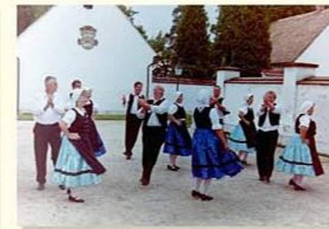
Remény napi ünnep a kecskédi táncosokkal a majki kamalduli remetesség udvarán