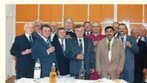
Az egyházközség testületi tagjai köszöntik Takács Nándor püspököt és Nagy László plébánost