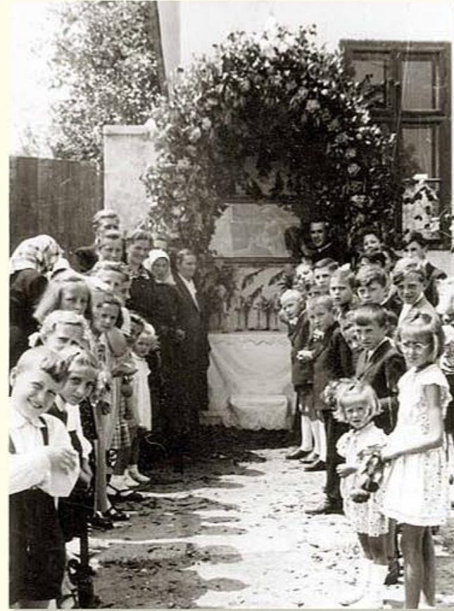
Az úrnapi sátor díszítésében részt vevő hívők különböző életkorú gyülekezete a plébánia előtt