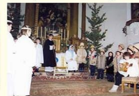
Betlehemes fiatalok az 1980-as évek második felében