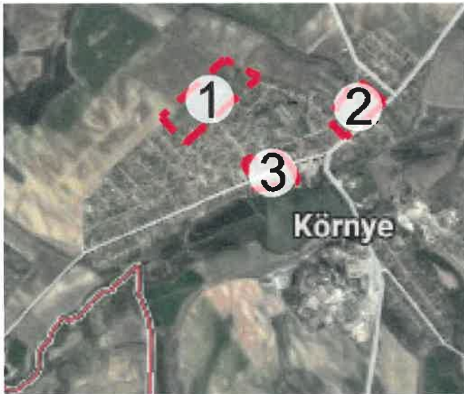
A tervezési területek légifotón