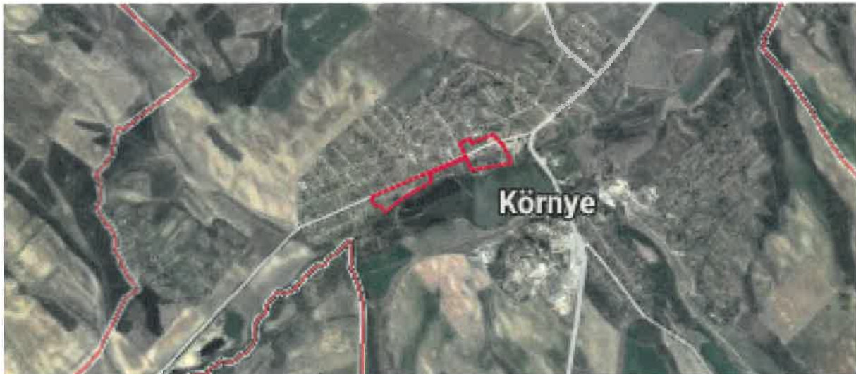
A tervezési terület légifotón

Beloianisz utca déli oldala (53-67 hrsz.), illetve a Váczi Mihály utca és a Régiposta utca között