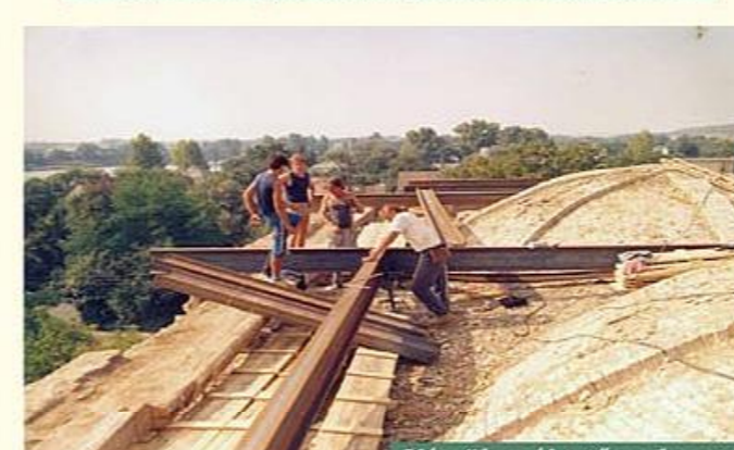
Készül az új tetőszerkezete