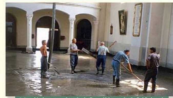
Megújul a templombelső padlózata belső fűtéssel