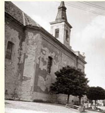
Háborús viszontagságok után