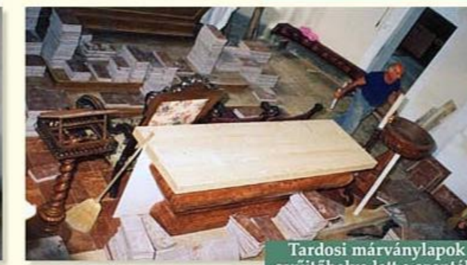
Tardosi márványlapok gyűjtőhelye lett a szentsír