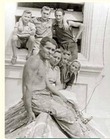
Falubeli fiatalok segítik a pallér munkáját