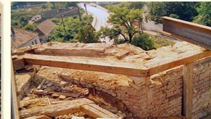
A tető tartószerkezetét vasgerendákra cserélik