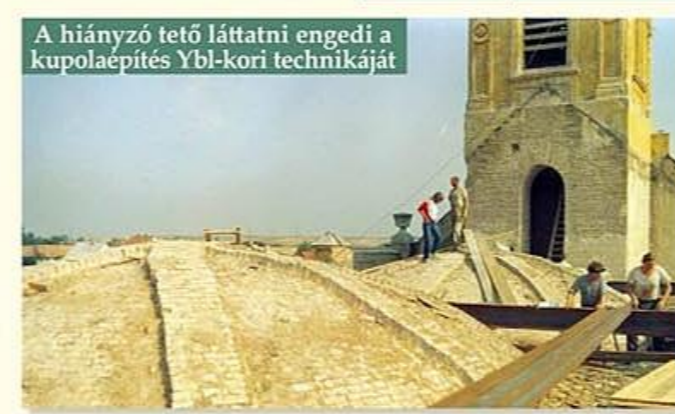
A hiányzó tető láttatni engedi a kupolaépítés Ybl-kori technikáját