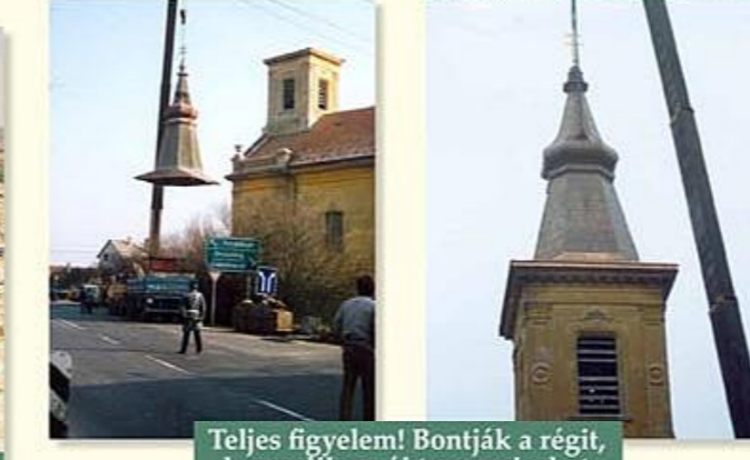
Teljes figyelem! Bontják a régit, beemelik az új toronysisakot