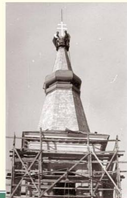
1955-ben a kettős kereszt visszahelyezése több volt egyszerű jelképnél

hez helyzetekben mindig velük van. Tanít megérteni a hit igazságait.