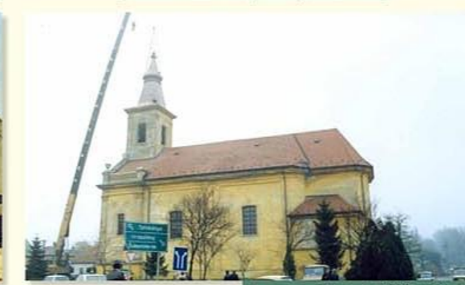
A nagy pillanat: 1989 telén helyére került az új „rézspika”!