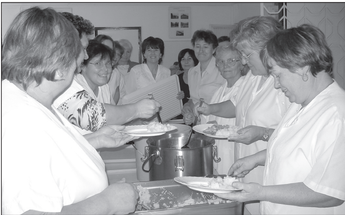
Az aktivisták, segítők csoportjai