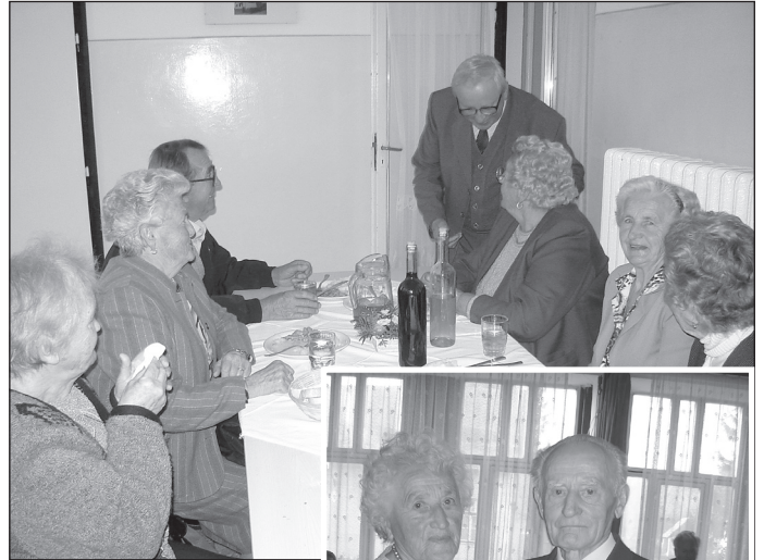
A hangulat emelkedett