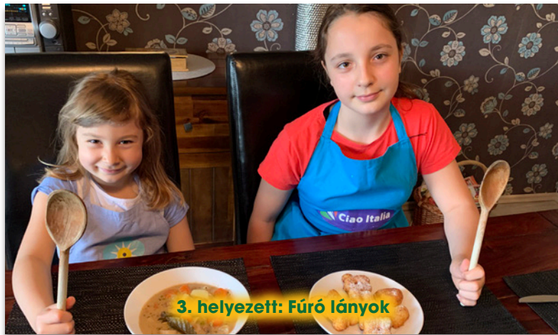
3. helyezett: Fűrő lányok