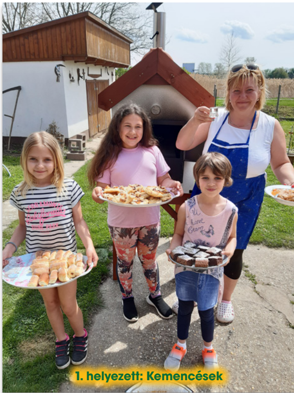
1. helyezett: Kemencések