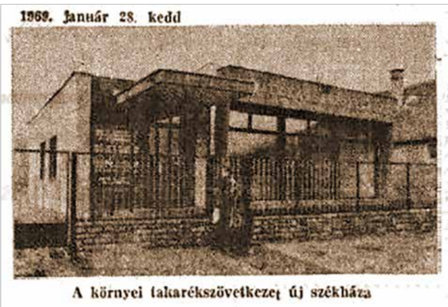
A környei takarékszövetkezet új székháza

Eleinte nehezítette a szervezést, hogy a II. világháború alatt és után elszenvedett veszteségek miatt csökkent a lakosság bizalma a pénzintézetek iránt, de a dolgozók, tisztségviselők és aktívabb tagok házról-házra járva győzték meg az újabb és újabb tagokat, és lassacskán előkerültek a szalmazsákokban, szekrényekben gyűjtögetett forintok. Ma már megmosolyogtató, de abban az időben a bizalom megszerzése érdekében a takarékszövetkezetnél lehetett könyvet, hanglemezt, autóbuszjegyet vásárolni és befizetni a szentet is.